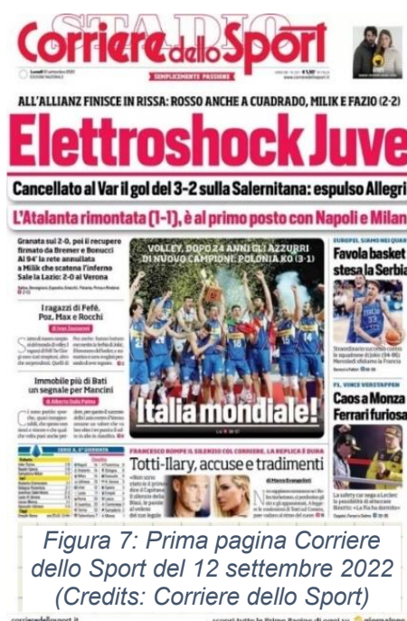
Figura 7: Prima pagina Corriere dello Sport del 12 settembre 2022