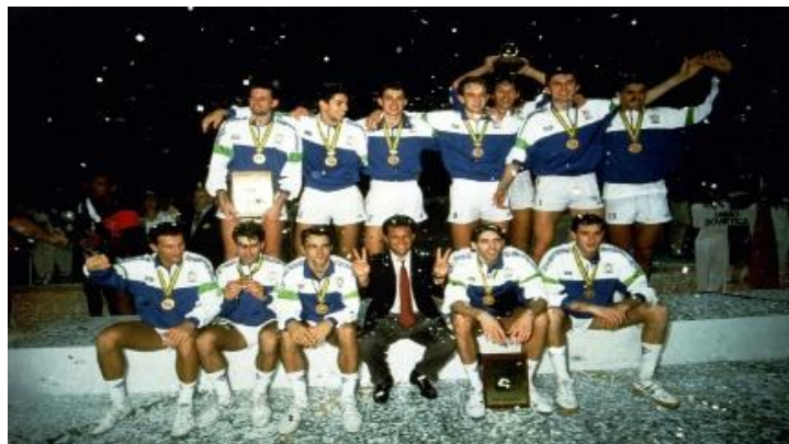
Figura 2: La formazione del 1990 sul podio mondiale

La nazionale italiana riuscì a sconfiggere in semifinale i padroni di casa del Brasile con una partita finita al tie-break e nella finale si impose con un risultato di 3-1 sulla squadra cubana, laureandosi così Campione del Mondo. Grazie a questo successo il volto del volley in Italia cambiò completamente e andò incontro a una notorietà mai vista prima. I tifosi italiani si avvicinarono alle imprese di questa nazionale di giovani vincenti e li seguirono anche negli anni successivi, quando replicarono il trionfo mondiale nel 1994 e nel 1998 e nel 1996 si aggiudicarono l'argento olimpico (Sito Fipav, 70 anni di storia) 13 .