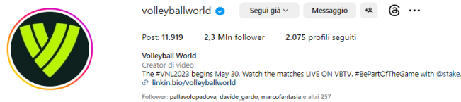
Figura 10: Profilo Instagram di Volleyball World che conta 2,3 milioni di followers al 21 agosto 2023

La pallavolo, dunque, è molto presente sul web anche grazie a blog dedicati, che permettono agli appassionati di partecipare a discussioni e condividere foto e video. I social media hanno però un ruolo di primo piano: Twitter da anni è diventato il social dove sia tifosi che addetti ai lavori commentano le partite in tempo reale attraverso hashtag specifici delle varie competizioni; su Instagram invece si possono trovare sia profili che si occupano di approfondimenti sulle partite, sia profili ufficiali di network come Eurosport che da anni dà sui suoi canali la stessa attenzione a tutti gli sport, con post dedicati soprattutto alle squadre nazionali.