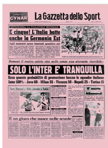
Figura 4: Prima pagina della Gazzetta dello Sport del 26 settembre 1978