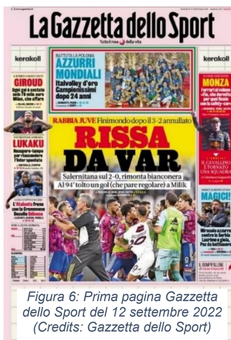
Figura 6: Prima pagina Gazzetta dello Sport del 12 settembre 2022

Infatti, andando ad analizzare gli spazi dedicati al volley nei giornali sportivi si può notare come solo durante le Olimpiadi la pallavolo abbia una copertura sufficiente. Prendendo come oggetto di analisi la vittoria del mondiale 2022 da parte della Nazionale Italiana di Pallavolo, salta all'occhio un non adeguato spazio in prima pagina dedicato all'impresa dei ragazzi di De Giorgi se lo si compara alle notizie calcistiche del giorno che occupano gran parte della pagina.