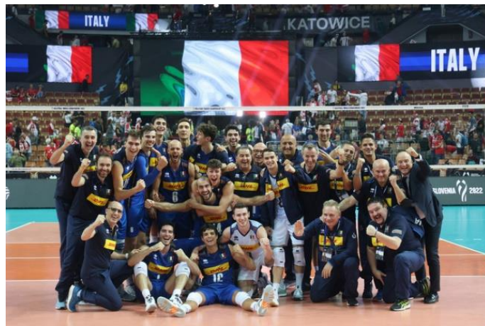
Figura 3: La formazione della nazionale italiana campione del mondo 2022

«È un risultato storico, non si vinceva un Mondiale da 24 anni e io ero in quella squadra... è stato veramente incredibile. Questi ragazzi mi hanno fatto vivere delle emozioni straordinarie, è stato come un passaggio generazionale da allenatore a giocatori, un lungo abbraccio con la maglia azzurra. Questi ragazzi si sono spesi in un progetto di crescita, sono giovani talentuosi e sono un motivo di fiducia e di speranza per il nostro paese, perché generano valore» (Ferdinando de Giorgi, 12 settembre 2022) 16 .