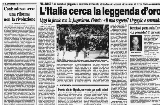
Figura 8: Pagina interna del Corriere della Sera del 29 novembre 1998 con riquadro dedicato alla polemica per la mancata diretta

Il successo mediatico della 'generazione di fenomeni' continuò fino alla fine degli anni '90 con la finale olimpica ad Atlanta 1996 che venne seguita da 6.520.000 spettatori, con uno share del 47,90% (Ingrati, 1999. p.72) 24 . Fu un picco che la pallavolo per anni faticò a replicare e già dalla vittoria del mondiale del 1998 l'interesse cominciò a scemare soprattutto a causa dei diritti tv (venduti a Stream e non alla Rai) che impedirono a gran parte degli appassionati di seguire il terzo oro mondiale consecutivo e provocarono non poche polemiche.