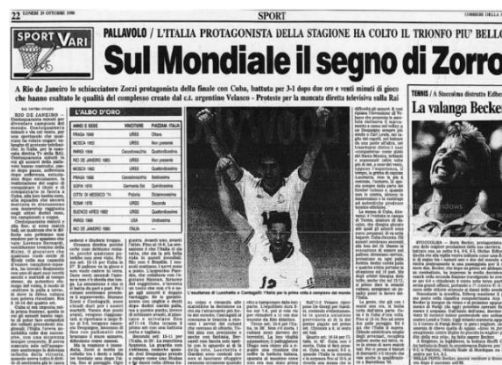
Figura 5: Spazio dedicato alla pallavolo all'interno del Corriere della Sera il 29 ottobre 1990

«L'Italia di quegli anni ha veramente cambiato il modo di guardare alla pallavolo nelle redazioni giornalistiche. Era scontato che si stravolgersero pagine e pagine già costruite per amplificare la sorpresa del volley. È grazie alla lunga collana di vittorie della nazionale che la pallavolo ha alzato spesso la voce. Ha costretto giornali nazionali a seguire il fenomeno volley» (Pistelli, 2009) 20